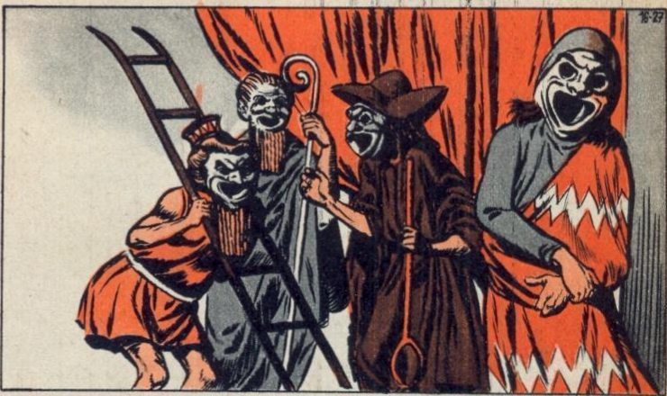
5. - VIVE LA COMEDIE !

N E pensez pas pourtant que les Athéniens quittaient chaque fois le théâtre, les cheveux hérissés et les yeux humides ! Ils étaient amateurs de comédie et aucun peuple n'a jamais su rire comme eux. Les acteurs portaient alors des masques hilares et ils se livraient à des bouffonneries énormes. Le meilleur auteur comique fut Aristophane. Il ridiculisait tout, surtout les politiciens. En écoutant ses pièces, les spectateurs étaient malades de rire !