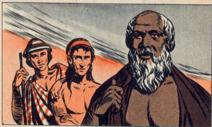
1. - UN GRAND PHILOSOPHE